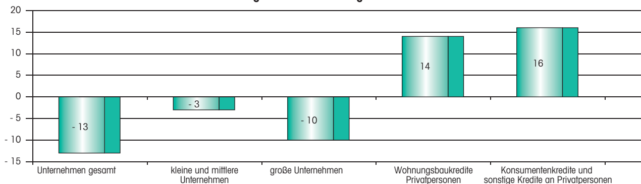
Entwicklung der Kreditnachfrage in Deutschland

Der Nettosaldo wird berechnet als Differenz zwischen der Summe der Angaben unter „deutlich gestiegen“ und „leicht gestiegen“ und der Summe der Angaben unter „leicht gesunken“ und „deutlich gesunken“ (in Prozent der gegebenen Antworten).