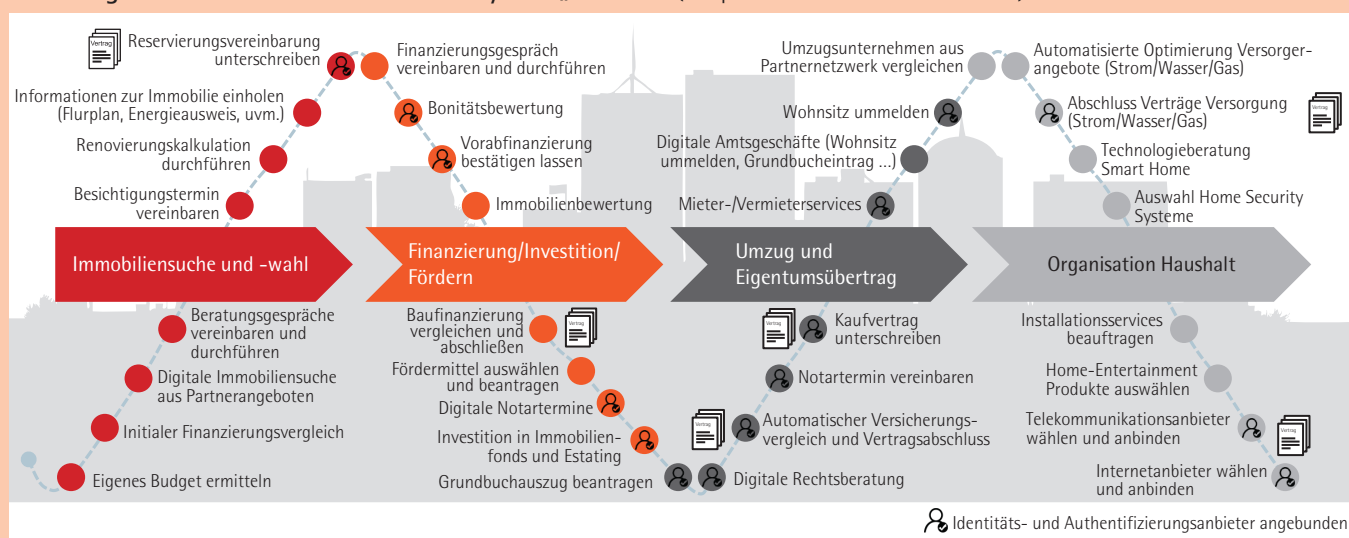
Abbildung 1: Potenziale für Banken im Ökosystem „Wohnen“ (beispielhafte Auswahl an Use Cases)