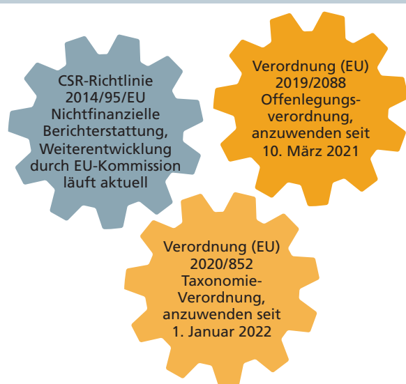
Abbildung 1: Offenlegungspflichten mit Nachhaltigkeitsbezug greifen ineinander und bauen auf der EU-Taxonomie auf

Weiter legt § 289 c HGB fest, dass in der nichtfinanziellen Erklärung das Geschäftsmodell der Kapitalgesellschaft kurz zu beschreiben ist und sie sich zumindest