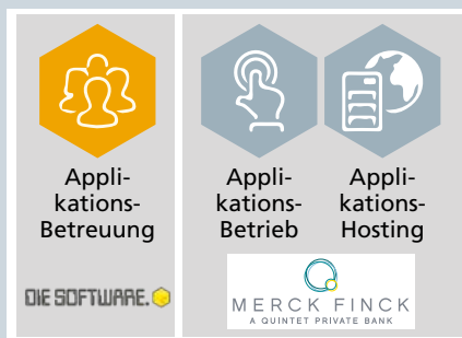
Abbildung 1: Das Auslagerungsmodell bei Merck Finck

Mit diesen Prämissen zahlt die Auslagerung voll auf den Ansatz eines hybriden Beratungsmodells ein.