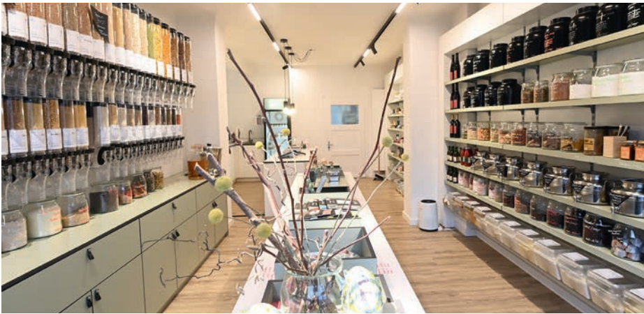
Ein neuer Unverpackt-Laden in Köln wurde 2020 von der Sparkasse Köln-Bonn bei der Gründung begleitet